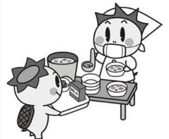
津山市食育推進キャラクター「しよくたん」